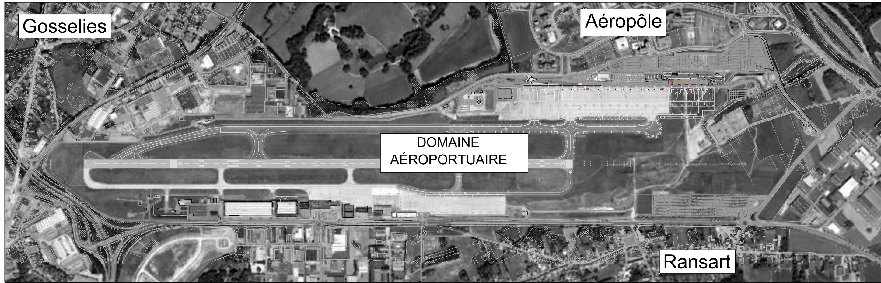
Situation dans le contexte